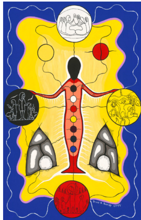
Représentation de la norme d'exercice Connaissances professionnelles

Les membres de l'Ordre visent à tenir à jour leurs connaissances professionnelles et saisissent les liens qui existent entre ces connaissances et l'exercice de leur profession. Ils comprennent les enjeux liés au développement des élèves, aux théories de l'apprentissage, à la pédagogie, aux programmes-cadres, à l'éthique, à la recherche en éducation, ainsi qu'aux politiques et aux lois pertinentes. Les membres y réfléchissent et en tiennent compte dans leurs décisions.