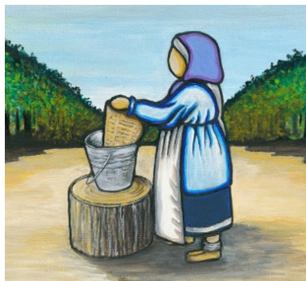
Représentation rotinonhsyón:ni du concept d'empathie