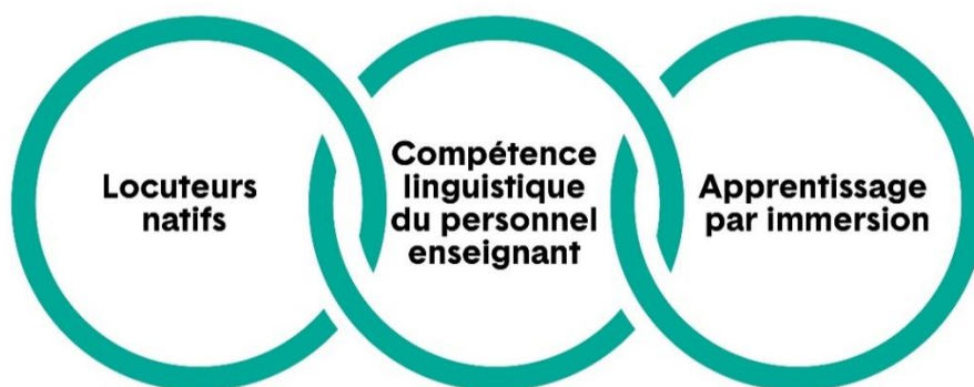
Figure 1 : Contexte important pour l'élaboration et la prestation du cours

La stabilisation de la perte linguistique pour rétablir les langues des Haudenosaunes, que ceux-ci croient avoir reçues du Créateur, est essentielle au maintien de leurs civilisations. Les valeurs et les connaissances culturelles des Haudenosaunes sont inhérentes aux langues, et l'haudenosaune y est profondément ancré, tout comme il l'est dans les territoires, les cérémonies, les pratiques culturelles et le mode de vie des Haudenosaunes, lesquels ont transcendé le colonialisme, y compris l'époque des pensionnats. Dans cette optique, les éléments suivants sont ajoutés comme points supplémentaires à considérer pour le développement et la prestation du cours menant à la qualification additionnelle Enseignement de l'onondaga, 2 e partie :