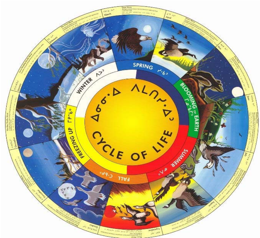
Schéma n° 1 : Cycle de la vie