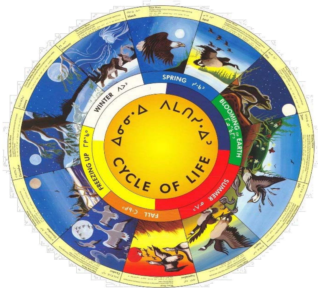
Cycle de la vie

Annexe D – Règlement sur les qualifications requises pour enseigner Janvier 2021