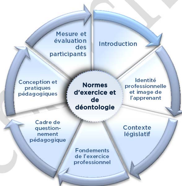
Schéma n° 1 : Cadre conceptuel

La ligne directrice du présent cours est fondée sur le cadre conceptuel suivant :