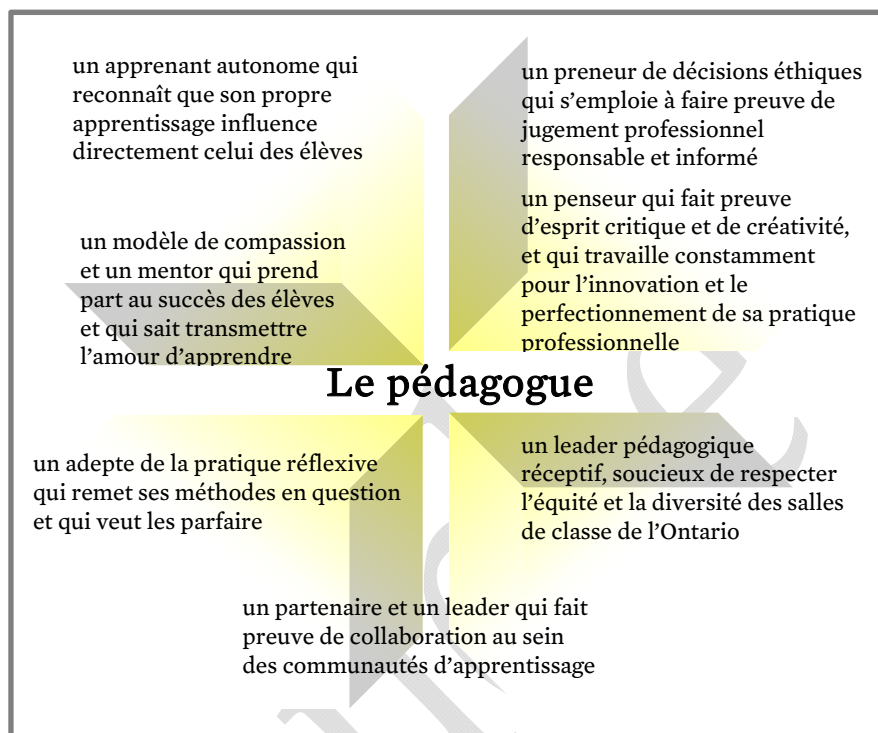
Schéma n° 2 : Image du pédagogue 1

L'image de l'élève dans la présente qualification additionnelle (schéma n° 3) est celle d'un apprenant indépendant, autonome, démocratique, averti, créatif, collaborateur, éthique, réfléchi, conciliant, inclusif, courageux et assuré; un penseur critique qui sait résoudre les problèmes et dont la voix et le sens de l'efficacité sont essentiels à la mise au point des méthodes d'enseignement et d'apprentissage.