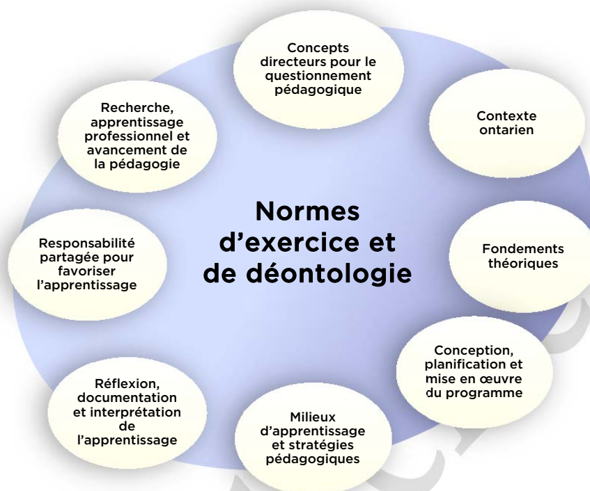
Schéma n° 4 : Cadre de questionnement pédagogique pour le cours Enseignement et leadership en situation minoritaire, 1 re partie