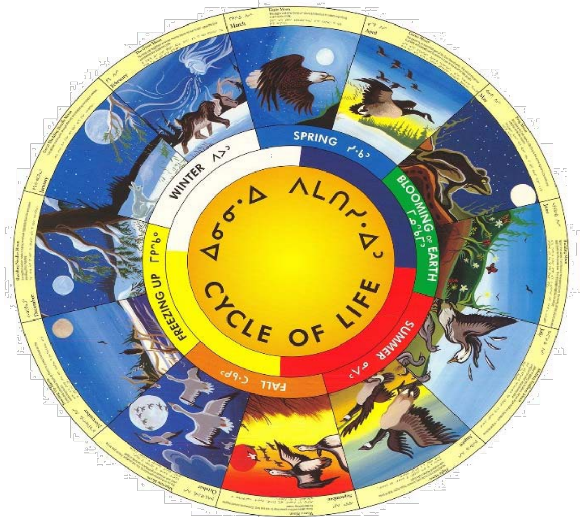
Schéma n° 1 : Cycle de la vie