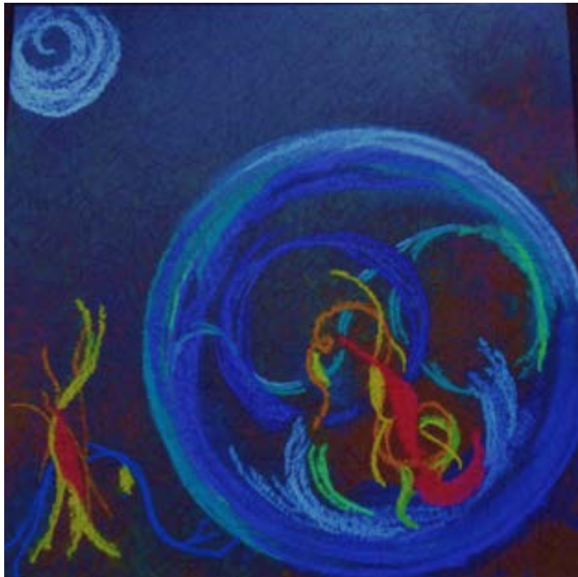
Création de Dale Cimolai, EAO